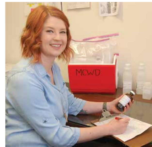
Paghahanda ng sample ng tubig para sa pagsusuri.

Ang radon ay isang radioactive gas na hindi mo makikita, malalalahanan o maaamoy. Nakikita ito sa buong U.S. Ang radon ay nakakagalaw pataas mula sa lupa at papasok sa bahay sa pamamagitan ng mga crack at butas sa pundasyon. Ang radon ay maaaring mabuo sa matataas na lebel sa lahat ng klase ng mga bahay. Ang radon ay maaari ring pumasok sa hangin sa labas kapag lumabas mula sa tubig sa gripo mula sa pag-shower, paghuhugas ng pinggan at ibang aktibidad sa bahay. Kumpara sa radon na pumapasok ng bahya sa pamamagitan ng lupa, ang radon na pumapasok sa tubig sa gripo ay sa karamihan ng mga kaso ay maliit na pagkukunan ng radon sa hangin sa loob. Ang radon ay kilalang nakaka-kanser sa bahay. Ang paghinga ng hanging may lamang radon ay maaaring magdulot ng kanser sa baga. Ang inuming tubig na may lamang radon ay maaari ring mapataas ang peligro